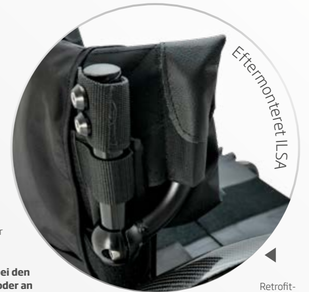
Retrofit-Version des Wing Back ILSA

Mit der Wing Back ILSA Retrofit-Variante mit Kugelklemmen können Sie auch Rollstühle anderer Hersteller problemlos umrüsten!