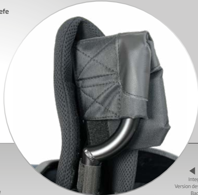
Integrierte Version des Wing Back ILSA

(Standard- Versatztiefen: 3 cm, 5 cm, 7 cm)